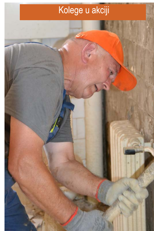
Kolege u akciji

BOFOS je donirao hilti bušilicu Organizaciji mladih iz Obrenovca, kao i nekoliko čekića i lopata, po njihovoj želji.